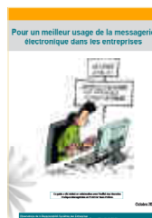
Pour un meilleur usage de la messagerie électronique dans les entreprises