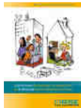
Etat des lieux des pratiques de négociation sur le télétravail dans les entreprises en France