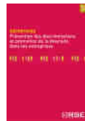
Prévention des discriminations et promotion de la diversité dans les entreprises