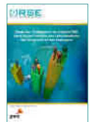
Intégration de critères RSE dans la part variable des rémunérations des dirigeants et des managers