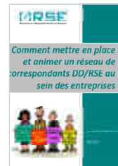
Comment mettre en place et animer un réseau de correspondants DD/RSE au sein des entreprises